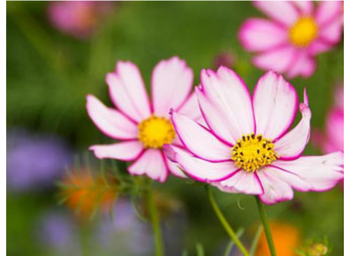
تسمية سيدنا يوسف بالصِّدِّيق

إن صاحبك هذا يدَّعي أنه أُسْرِيَ به وُجِرَ به إلى السماء ثم عاد في ليلته، فما تردد قال: إن كان قالَ قَدَّ صدَّق، من هنا سُمِّي الصِّدِّيقُ لأنه لم ينتظر، لم يقل: سأراه وأسأله وبعد ذلك أجيبكم، فوراً إن كان قالَ قَدَّ صدَّق، فسمي الصِّدِّيقُ، ويوسف عليه السلام لما راوا من صدقه ما راوا في سجنه وفي تعامله مع الآخرين وصدقته يوم أنهم هذه التهمة الباطلة وكان صادقاً فيها وأتى بالشاهد، لما راوا صدقه في أقواله وأعماله وأحواله جاءه رسول الملك قال: (يُوسُفُ أَيُّهَا الصِّدِّيقُ) وأنتها الله قرأنا يتلى إلى يوم القيامة.