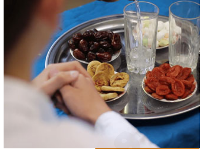
إمساك المسلم العاقل عن جميع المفطرات

فالصيام؛ هو الامتناع (إِنِّي تَدْرُتُ لِلرَّحْمَنِ صَوْمًا) جاء الامتناع هنا عن الكلام هذا في اللغة.