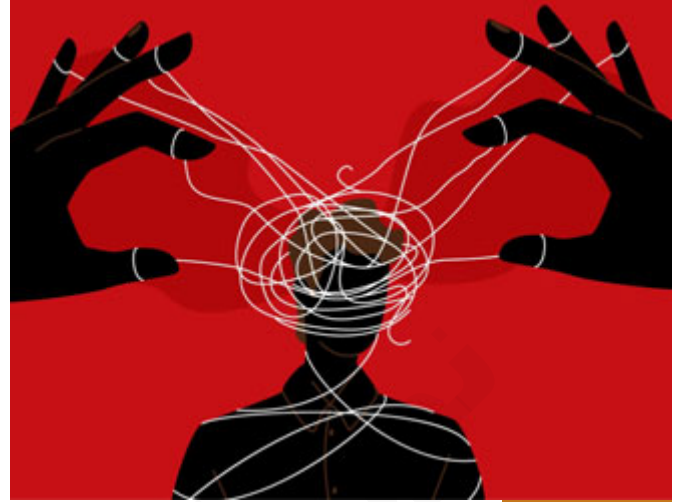
الشيطان يزين العمل

لا دخل لي أبدأ، أنا قلت لكم إنزلوا فنزلتم، فمن المضحك أن تقول الشيطان، كما يقول بعض الناس، كلما يفعل شيئاً سيئاً تقول له: لماذا فعلت هذا؟ يقول: لعن الله الشيطان، نعم لعن الله الشيطان، لكن أنت لماذا فعلت ما أمرك به الشيطان؟ فالشيطان يزين العمل، بمعنى أنه يظهره على أحسن وجه وهو في أسوأ وجه، يزينه فيقبله بعض الناس الذين ليس عندهم الإيمان القوي الذي يدفعهم إلى عدم الوقوع في حبال الشيطان ﴿إِذْ رَيْنَ لَهُمُ الشَّيْطَانُ أَعْمَالَهُمْ وَقَالَ لَا غَالِبَ لَكُمْ الْيَوْمَ مِنَ النَّاسِ﴾ يعني الشيطان اتخذ حيلة عجيبة جداً، هو جعلهم يقبلون على شيء لا طاقة لهم به، ثم قال: ﴿إِنِّي أَرَى مَا لَا تَرَوْنَ﴾ رأى الملائكة تقابل في صفوف المؤمنين.