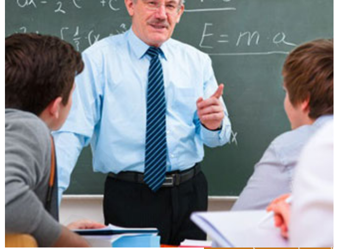
أعظم الأمانات هي أمانة الواجب