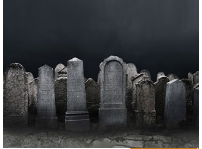
أصعب العذاب انتظار العذاب

بارك الله بكم، كما تفضلتم هذه الآية في الأنفال، وهي آية تثبت ما ينفيه اليوم بعض الذين يتكلمون على وسائل التواصل، وهو موضوع عذاب القبر الذي كان النبي صلى الله عليه وسلم يستعذب منه دائماً قبل ختام الصلاة، فيقول أعود بك من أربع، ومنها عذاب القبر، فهذه الآية تثبت هذا العذاب؛ لأنها تتحدث عن البرزخ، وَلَوْ تَرَىٰ إِذْ يَتَوَفَّى الَّذِينَ كَفَرُوا ۖ الْمَلَائِكَةُ ۖ فِي لَحْظَةِ الْوَفَاةِ يَبْدَأُ الْعَذَابَ ۖ يَضْرِبُونَ وُجُوهَهُمْ وَأَدْبَارَهُمْ وَذُوقُوا عَذَابَ الْخَرْقِ ۖ أنا أشبه عذاب القبر برجل محكوم بالإعدام قد وُضع في زنزاة مفردة، وهو مهيباً للإعدام، وهناك أوقات يُفْتَحُ فيها الباب ويُقَدَّمُ له بعض الطعام، لكن كلما فُتِحَ الباب في وقت غير مخصص للفتح وللطعام يقول: قد جاؤوا لأخذي إلى الإعدام، فيعيش حالة الرعب الدائم المستمر إلى أن تحين ساعة القصاص العادل، المحكمة التي أقرت حكم الإعدام، وهذا الذي بنى مجده على أنقاض الناس، وطغى وبغى، وكفر بالله، وأساء إلى عباد الله تعالى، في حياة برزخه يُعَذَّبُ، فمنذ أن يغادر الدنيا إلى أن يلقى الله تعالى هو في حالة عذاب مستمر؛ لأنه ينتظر العذاب، وأصعب العذاب انتظار العذاب، وأجمل السعادة انتظار الفرح والسعادة، فيعيش تلك الحياة وَلَوْ تَرَىٰ إِذْ يَتَوَفَّى ۖ لرأيت عجايب الجواب محذوف، لرأيت عجايب منهم وهم يَضْرِبُونَ وُجُوهَهُمْ وَأَدْبَارَهُمْ ۖ لأن الموت عندهم مصيبة، بينما الموت عند المؤمن تحفة المؤمن، وعرس المؤمن، غداً تلقى الأعبة محمد وصحبه، فالموت عند المؤمن بداية الخير، وبداية السعادة، من لحظة وفاته تبدأ حياة البرزخ سعيدة هنيئة لأنه سيلقى ربه.