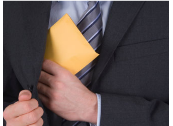
أعظم ما في أمراض الحرب هو الخيانة

بارك الله بكم، الحقيقة كما تفصلتم في موضوع ورود الخيانة في ثلاث آيات في هذه السورة بلغت الأنظار، والحقيقة أن السورة ما دامت تتحدث عن الجهاد، وعن الحرب فإن أعظم ما في أمراض الحرب هو الخيانة، وأعظم ما يدخل إليه الأعداء إلينا هو الخيانة، لذلك جاء ذكر الخيانة في هذه السورة بشكل واضح، كما تفصلتم اليوم الله تعالى يقول: لَا تَخُونُوا اللَّهَ وَالرَّسُولَ وَتَخُونُوا أَمَانَاتِكُمْ وَأَنْتُمْ تَعْلَمُونَ وجاء بالأمانات بالجمع، فما قال: ولا تخونوا أمانتكم وإنما قال أَمَانَاتِكُمْ ، فالأمانات متنوعة، وليست الأمانة كما يظن البعض بأنها مجرد أن إنساناً سافر ووضع عندك مالا وأمنك عليه، وهذا نوع من أنواع الأمانة بلا شك ثم عاد فأعطيت المال، هو أمانة ولكن ليس كل الأمانة.