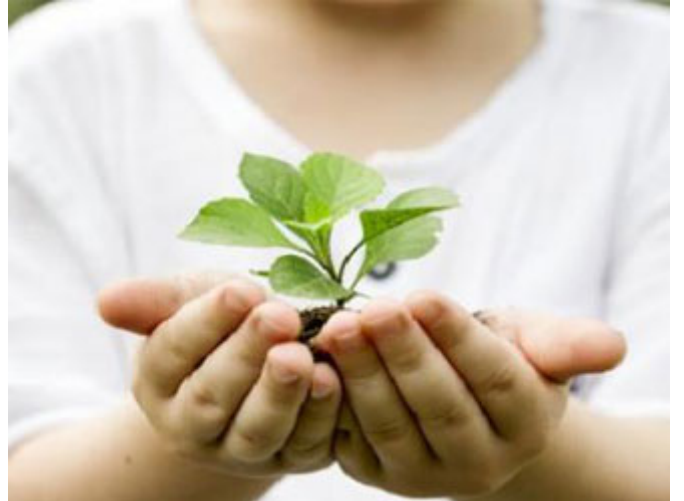
السعادة في العطاء وليست في الأخذ

أما الشيء الثاني الذي يسعدنا في رمضان فهو في قول من سُئِلَ: