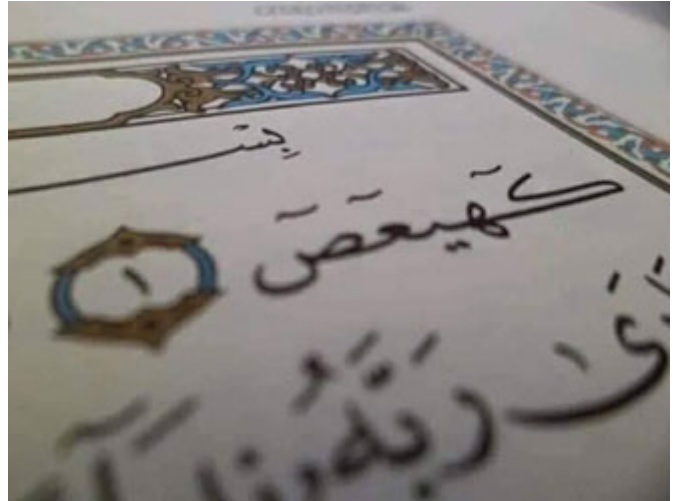
وردت الأحرف المقطعة في 29 سورة

(الر) هذه أحرف مقطعة، وردت في تسع وعشرين سورة من سور القرآن: (يس)، (طه)، (الم)، (ق)، وقد وردت إما حرفاً واحداً في بداية السورة كقوله تعالى: (ن)، (ق)، (ص)، في ثلاث سور، وإما حرفان في تسع سور: (يس)، (طه)، (حم)، وإما ثلاثة أحرف كقوله تعالى: (الم)، (الر)، وإما أربعة أحرف (المرا)، (المص) في سورتين، وإما خمسة أحرف في سورتين: سورة مريم: (كهيعص)، سورة الشورى: (حم * عسق)، والذي يلفت النظر أنه في كل السور ما عدا أربع سور جاء ذكر القرآن الكريم بعد الأحرف المقطعة، كقوله تعالى