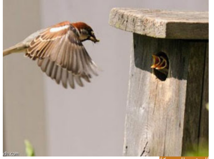
الرزق يتطلب حركةً

لكن لم يقل: لرزقكم كما يرزق الطير تجلس في أعشاشها وينزل إليها رزقها من السماء، قال: (تَعْدُو حِمَاصًا) هي جائعة فتتحرك فتزرق، فالرزق من الله لكن الحركة منك، هذا مفهوم غاية في الأهمية في حياتنا، أنا أعلم أنكم تفهمونه وتعملون به لكن أوضحه حتى نستطيع نقله إلى الناس بأن هذا هو ديننا، وأن الحياة اليوم لا تستقيم بالتوكل الساذج الذي هو في الحقيقة اتكال وليس توكلًا، لا أدري مدى دقة العبارة؛ أقول: لا تعتصموا على الله، يعني لا تعتب على الله أو لا تسئ الظن بالله عز وجل، حينما تجد أن المسلمين ليسوا في مقدمة الأمم في المئة سنة الأخيرة، أحسن الظن بالله عز وجل، فالله عز وجل سن لنا سنتنا هي اتخاذ الأسباب فلم نأخذ بها ولم نعمل بها، ما نعانیه اليوم أو ما تعانیه أمتنا اليوم هو نتاج تفكير لئمة سنة ماضية تركنا فيه ديننا وتركنا فيه العمل لدنيانا فتسلط علينا غيرنا.