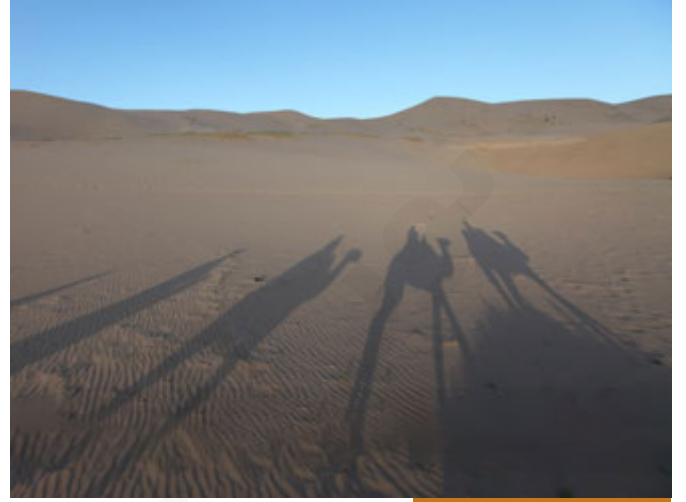
الخروج في غير الطريق المعتاد

من الترتيبات التي قام بها صلى الله عليه وسلم: أن أبا بكر أمر عامر بن فهيرة أن يرعى غنمه، من الترتيبات المهمة: مسؤولية الإطعام أسماء بنت أبي بكر، التموين، لم يقل: الله يطعمني ويسقيني، والله هو الذي يطعم وهو الذي يسقي لكن نحن مأمورون بالسعي فلا بد من تخصيص من يأتي بالطعام، فكانت أسماء بنت أبي بكر تأتيهم بالطعام، أيضاً من الترتيبات: أن النبي صلى الله عليه وسلم سار مساجلاً، فخرج في غير الطريق المعتاد الذي تسلكه قوافل قريش، غير الطريق، هم عندما يعرفون أنه خرج سيخرجون من طريق معينة، هو سار إلى الجنوب بعكس طريق المدينة ثم التف وهاجر إلى المدينة، أيضاً هذا من الترتيبات المهمة.