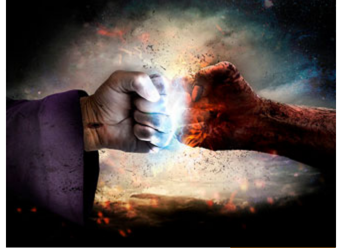
دورة الحق والباطل طويلة

لكن إن لم يتح لنا فهذه حكمة الله، لماذا؟ لأن دورة الحق والباطل طويلة أطول من عمر الإنسان، الذي عاشروا المغول والتتار مات كثيرون مظلومين ولم يروا النصر عليهم، الذي بنوا مع صلاح الدين الأيوبي من البدايات لم يروا صلاح الدين الأيوبي يوم حرر القدس، لم يروه بأعينهم لكن خلد اسمهم بأنهم كانوا معه في بداية المشوار والطريق، دورة الحق والباطل قد تكون أطول من عمر الإنسان؛ إذا كان رمضان يأتي في آب كل ثلاث وثلاثين سنة مرة وإنسان مات وعمره سبع وعشرون سنة قد لا يأتي عليه عام ويرى رمضان في آب ويعيشه، لأن الدورة طويلة، أيضاً الحق والباطل يتصارعان، فقد تمتد جولة الباطل فتكون أطول من جيل كامل لكن حسينا أننا إذا لقينا الله عز وجل نقول: يارب نحن عشنا في عصر فيه من السوء ما فيه، وفيه من الفتن ما فيه، وفيه من الصوارف ما فيه، وجاءتنا الشياطين لتشغلنا عن ديننا ولكننا بقينا ثابتين صامدين على الحق حتى لقيناك وأنت راض عنا، هذا يكفيننا إن شاء الله، وعملنا ما بوسعنا وبدلنا المستطاع في سبيل نصرة أمتنا وعزتها، هذه دروس من الهجرة أسأل الله تعالى أن ينفع بها. كل عام وأنتم الخير، والسلام عليكم ورحمة الله وبركاته.