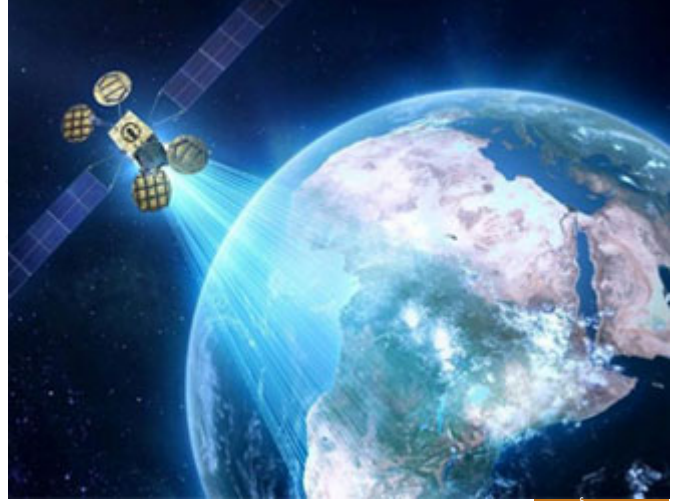
لكل عصر أسبابه

ذكر أن أحد الخلفاء مرَّ بقومٍ لا يعملون فقال: من أين تأكلون من أين تشربون؟ قالوا: الأعداء يعطوننا، قال لهم: كيف بكم إذا أصبحتم عبيدًا عندهم، فأدرك هذا الخليفة أن المستهلك هو الضعيف وأن المنتج هو القوي، لا بد أن نعطي الحياة أسبابها ولكل عصر أسبابه، قد تقول لي: ما هذه الترتيبات؟ أقول لك: والله في عصر النبي صلى الله عليه وسلم بهذه الترتيبات هذا أفضل ما يمكن فعله، اليوم في عصرنا تقول لي: هناك ترتيبات أخرى للرحلة، نعم، هناك أقمار صناعية، اليوم ممكن أن نراقب الأعداء عن طريق الأقمار، يمكن إعداد سلاح مختلف، الرحلة يمكن أن تصبح دبابية، لكن ما فعله النبي صلى الله عليه وسلم في عصره هو كل ما يمكن فعله، لم يترك شيئًا يمكن فعله إلا وفعله صلى الله عليه وسلم، فلما وصلوا إليه طهر توكله الحق على الله تعالى وظهر أنه ما كان قد أخذ بهذه الأسباب إلا تعبدًا لله تعالى لكن اعتماده الأوحى على رب الأسباب جلَّ جلاله.