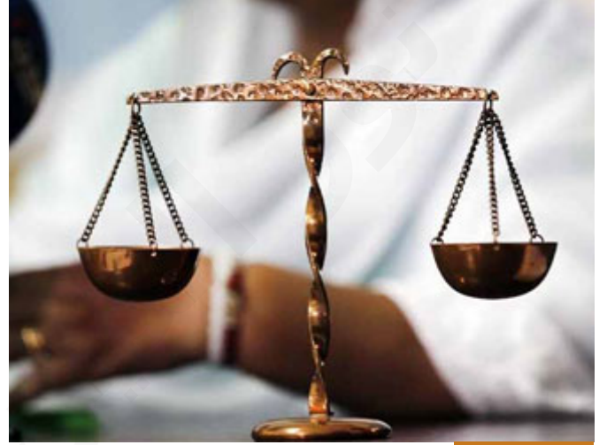
قواعد الميراث ثابتة

بِسْمِ اللَّهِ الرَّحْمَنِ الرَّحِيمِ وَلَكُمْ نِصْفُ مَا تَرَكَ أَرْوَاهُكُمْ إِنْ لَمْ يَكُنْ لَهَا وَوَلَدٌ فَإِنْ كَانَ لَهَا وَلَدٌ فَلَكُمْ لِرُغْمَا تَرَكَتُمْ مِنْ بَعْدِ وَصِيَّتِهَا أَوْ دَيْنِ وَأَنَّ كَانَ رَجُلٌ يُورَثُ كَلَّةً أَوْ مَرَأَةً وَلَهُ أَحٌ أَوْ أُخْتُ فَلِكُلٍّ وَوَجِدٍ مِّنْهُمَا لِسُدُسٍ فَإِنْ كَانُوا أَكْثَرَ مِنْ ذَلِكَ فَهُمْ شُرَكَاءُ فِي ثُلُثٍ مِنْ بَعْدِ وَصِيَّتِهَا يُوصَى بِهَا أَوْ دَيْنٍ غَيْرَ مُصَارَّاتٍ وَوَصِيَّةٌ مِّنَ اللَّهِ وَوَلِلَّهِ عِلْمٌ حَلِيمٌ (12)