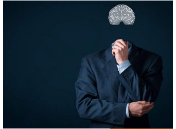
ركب الإنسان من عقل وشهوة