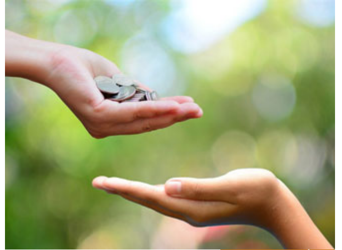
إنفاق أموالنا لإعلاء كلمة الله

بارك الله بكم، كما تفضلتم هذه الآية تمس واقعنا اليوم مساً شديداً، فالיום المعرضون عن الله تعالى تكالبوا على أمة الإسلام، اليوم ينفقون أموالهم لنشر الشذوذ في مجتمعاتنا، ينفقون أموالهم لهدم وتقويض أركان الأسرة التي نعتر بها، والتي نفاخر بها الأمم بأننا أمة الأسرة التي تبني الأسرة فتبني الأجيال، ينفقون أموالهم من أجل تحريف الحقائق، ومن أجل طمس الهوية، ومن أجل إشاعة الفاحشة في المجتمعات، ومن أجل إشاعة الإعلام الفاسد المفسد فهم ينفقون أموالهم، فأولاً ماذا فعلنا نحن؟ ماذا أنفقنا من أموالنا من أجل الحق؟ وهذه دعوة لكل الموسرين ولكل الذين وهبهم الله تعالى من المال أن يجعلوا دائماً جزءاً من أموالهم لنصرة الحق، لنصرة المستضعفين في الأرض لإعلاء كلمة الله تعالى، فكأن الله تعالى عندما يقول: ﴿إِنَّ الَّذِينَ كَفَرُوا يُنْفِقُونَ أَمْوَالَهُمْ﴾ كأنه يقول لنا: فماذا فعلتم أنتم أيها المؤمنون؟ هم ينفقون أموالهم ليصدوا عن سبيل الله، فهل أنفقتم أموالكم لإعلاء كلمة الله تعالى؟ هذا مفهوم مهم لهذا العقد، أن ننفق أموالنا لإعلاء كلمة الله في المساجد وأهم من ذلك في دور العلم، في المعاهد الشرعية، في معاهد القرآن الكريم، في مراكز القرآن، وحتى في مجالات العلم المختلفة لأنها جميعها قوة للمسلمين؛ فهذا المعنى الأول، المعنى الثاني: لا تعلقوا فإن هؤلاء مهما أنفقوا من أموالهم ليصدوا الناس عن دين الله وليبيعوهم عن دين الله تعالى فإنهم سينفقونها ثم تكونوا ندماً عليهم، حسرة عليهم، سيتحسرون لماذا؟ لأنهم أنفقوا ولم يحققوا أمالهم؛ لأن: