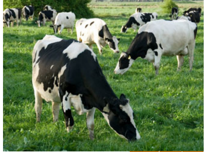
خُلقت الأنعام من أجل الإنسان

وإن كانت هناك أبحاث علمية تشير إلى أن أصل الحديد إنزال من النيازك والشهب، هذا بحث علمي يمكن أن يشير إلى كلمة وأنزلنا، لكن عموماً الإنزال ليس بالضرورة أن يكون شيئاً انتقل من الأعلى إلى الأسفل، وإنما عندما يكون هناك تسخير فيقال: أنزل، نزل القوم على حكم فلان؛ خضعوا له ولحكمه.